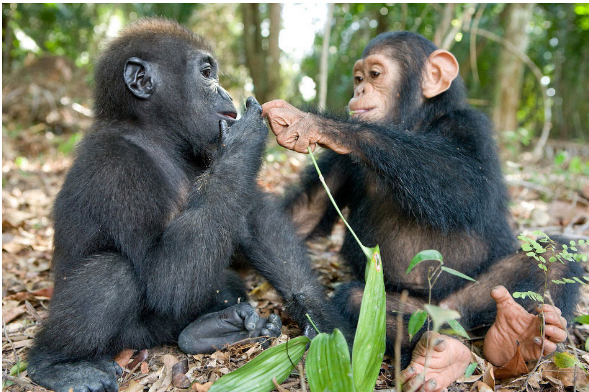
(da National Geographic).