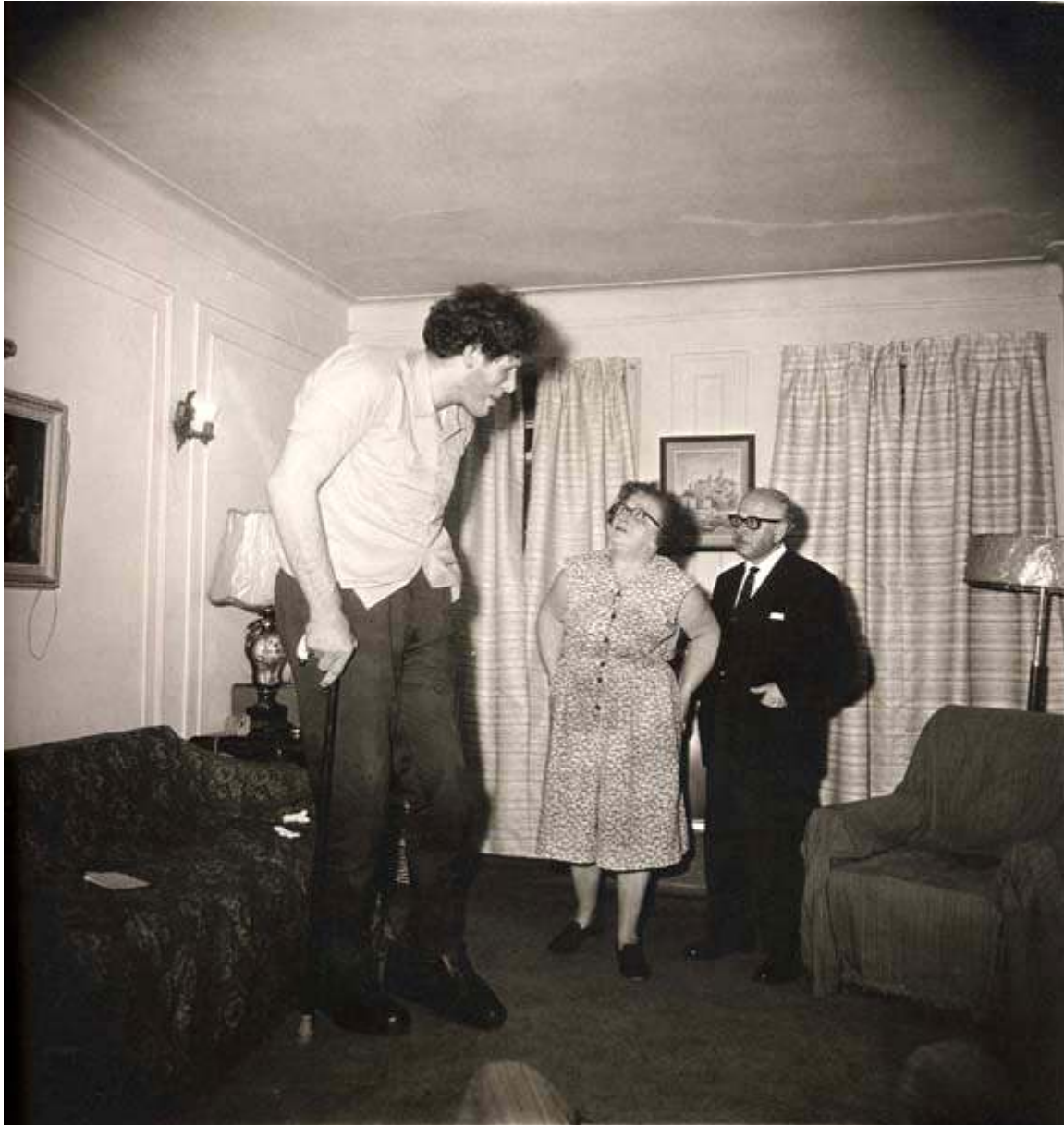
Diane Arbus, A Jewish giant at home with his parents in the Bronx NY 19.

Se pensiamo a ciò che scriveva Aristotele: “la natura passa gradatamente dagli esseri inanimati agli animali in modo che a causa della continuità la linea di demarcazione che separa gli uni dagli altri è sfumata e non è possibile determinare a quale dei due gruppi appartenga la forma intermedia. Così dopo la classe degli inanimati viene subito quella delle piante e fra esse una specie differirà dall’altra perché sembra partecipare maggiormente dei caratteri della vita. L’intero mondo vegetale, se lo si paragona ai corpi inorganici, appare in qualche modo dotato di vita, mentre paragonato agli animali appare inanimato”, possiamo dire che l’odierna concezione naturalistica della vita si discosta molto dalla progressiva linearità evolutiva, più nell’ordine invece della sincronicità.