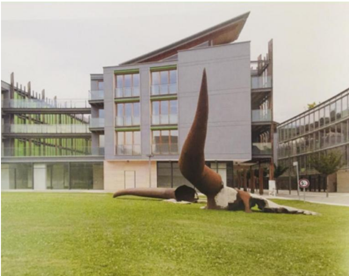
Brunivo Buttarelli, Taurus in terra, 2012.

Attenzione però, Pievani non ci porta dentro l'anestesia nichilista senza speranza, non significa che tutto è frutto del mero caso e che le nostre azioni sono irrilevanti. C'è molto da fare nel mondo dell'imperfezione. Potremmo per esempio trasfigurare il disincanto in ironia, ritagliarci un rifugio, ribellarci almeno alle imperfezioni umane rimediabili, quelle che per ingordigia e vanità di pochi generano futilmente ingiustizie e disuguaglianze per molti. Ma soprattutto "bisogna coltivare il nostro giardino" come Voltaire fa dire due volte a Candide in chiusura dell'opera. Se per giardino intendiamo quello terrestre, non lo abbiamo mai fatto e sarebbe ora di cominciare.